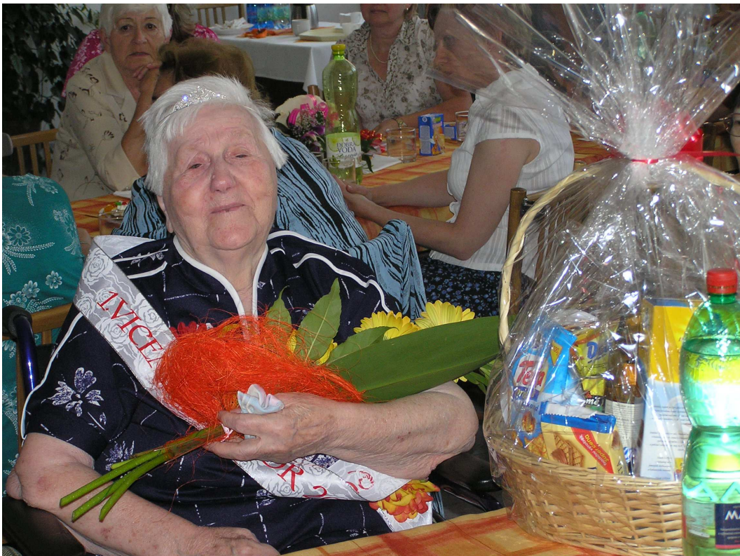
Na V. ročníku „Miss senior 2009“ získala naše uživatelka ocenění 1. vicemiss senior 2009. Srdečně blahopřejeme.