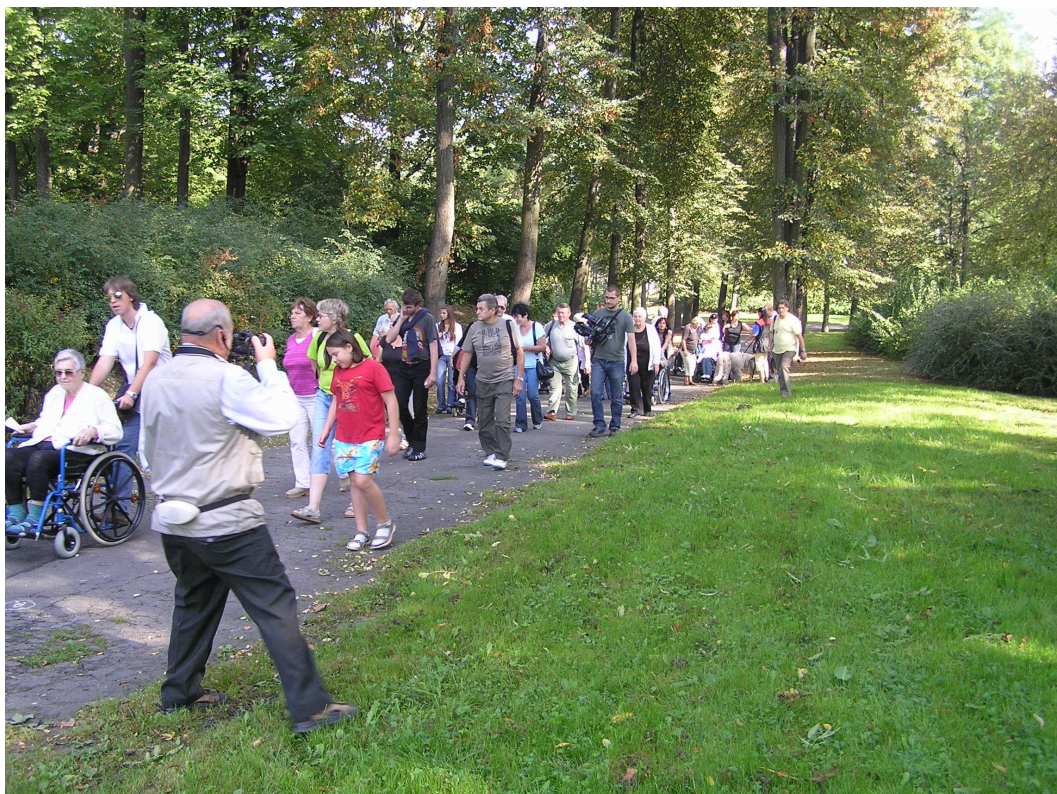
Díky finanční podpoře Nadace OKD jsme prožili krásné odpoledne spojené s procházkou starou Orlovou.