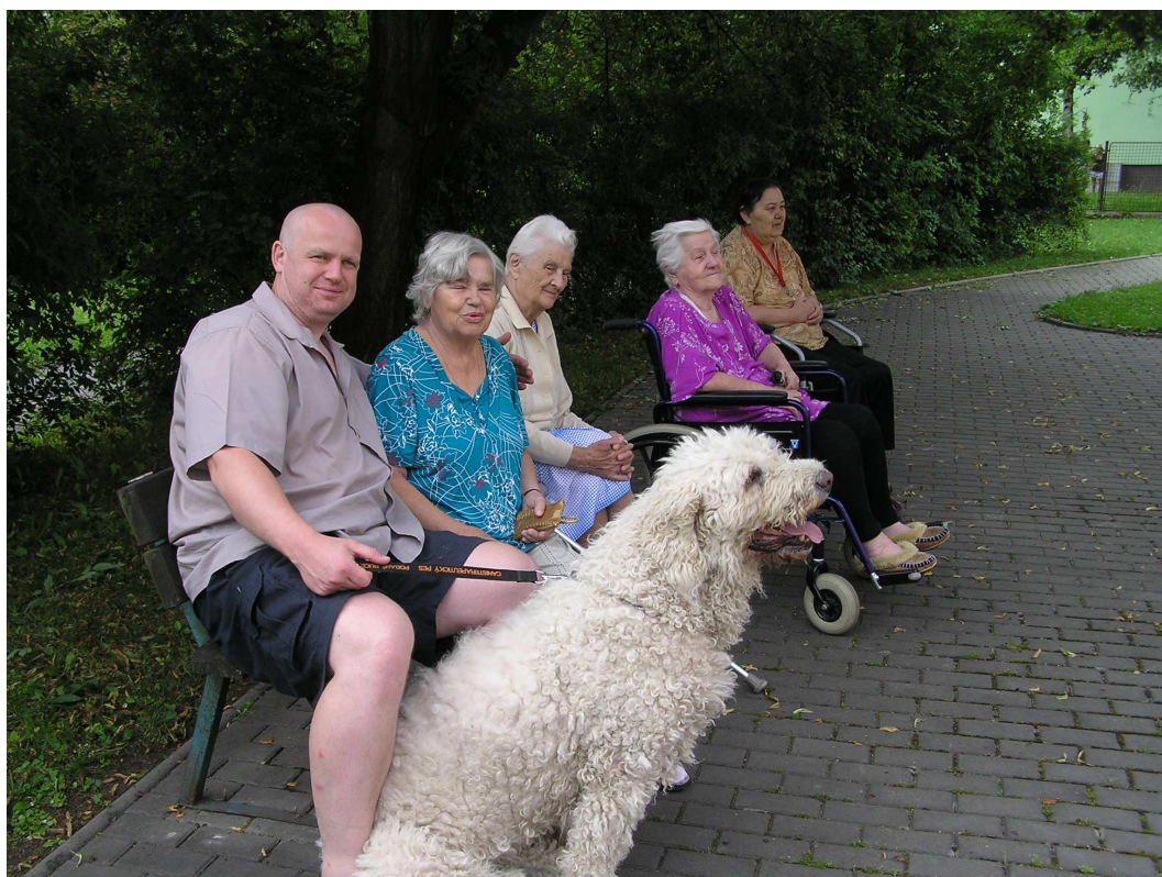
„Přítel je dar, který si sami dáváme“. Pochopili jsme, že i pes může být ten nejlepší přítel.