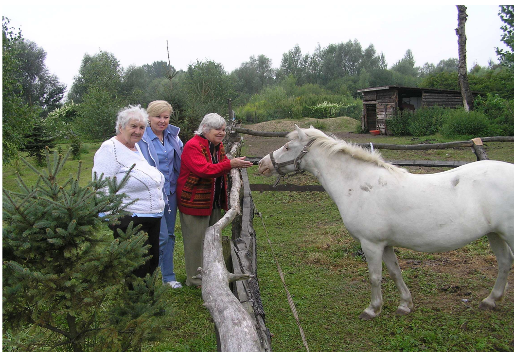
„Když člověk přírodu doopravdy miluje, tak mu to všude připadá hezké“.