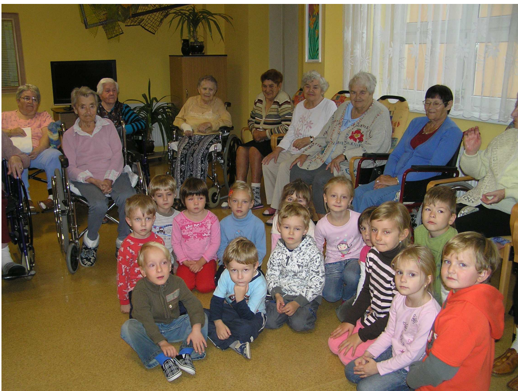
„Radost“ přináší radost – děti z MŠ nás vždy rozveselí.