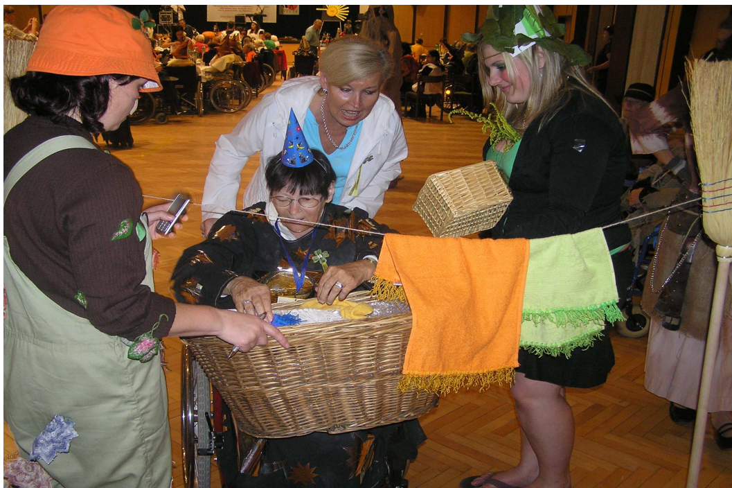
Návštěva u našich přátel v Gorzyczach.