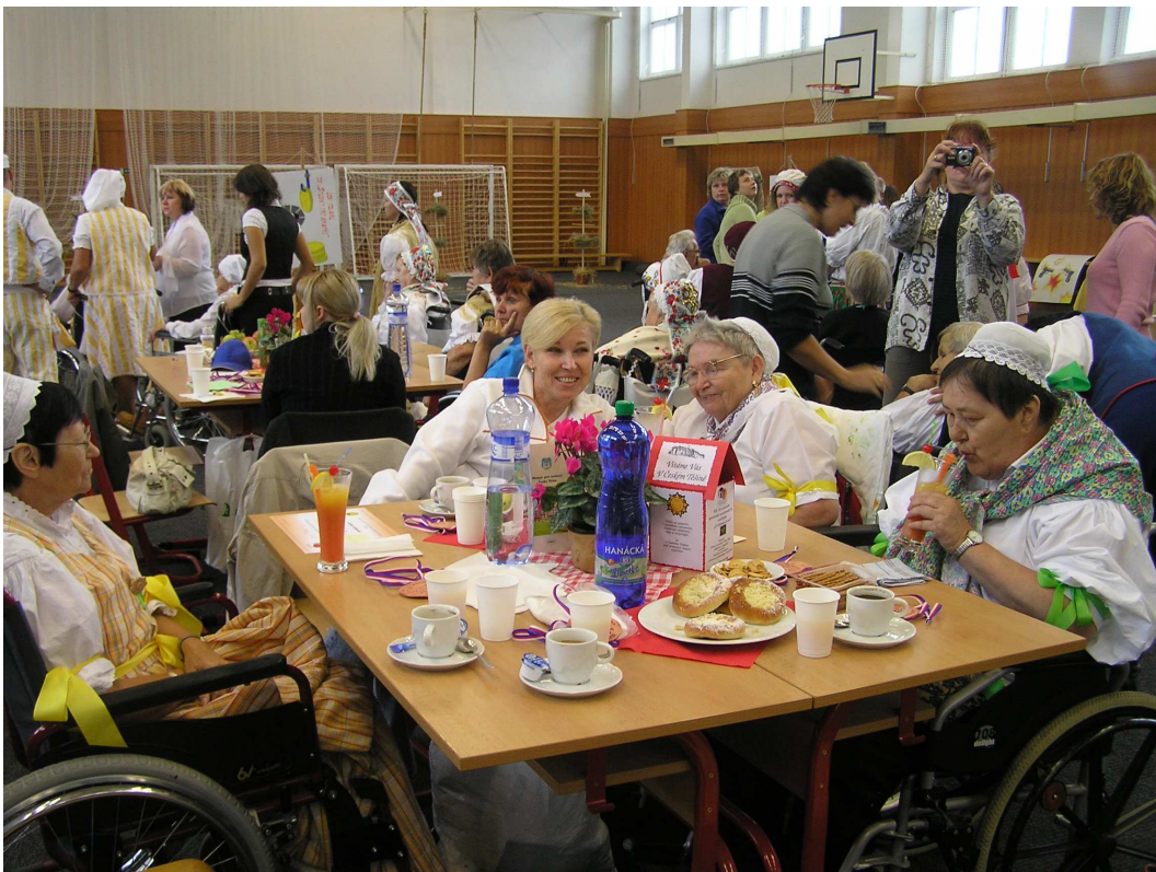
Již tradičně jsme se zúčastnili XII. MSSHV, tentokrát v Českém Těšíně. Program byl jako vždy velmi pestrý, nálada výborná a všichni si odvezli pěkné zážitky.