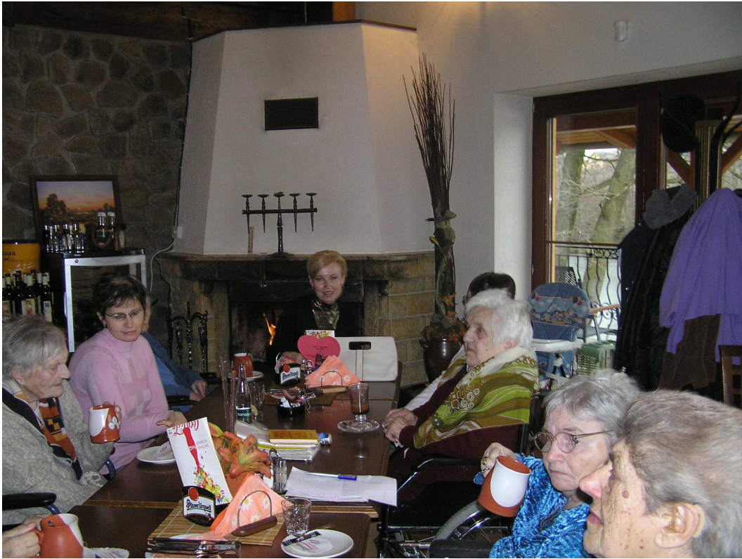
Na Hromnice o hodinu více... Tuto a mnoho dalších pranostik jsme si připomněli v restauraci Hastrmanka. Praskání ohně v krbu a známé melodie za doprovodu harmoniky proteplily tento zimní den.