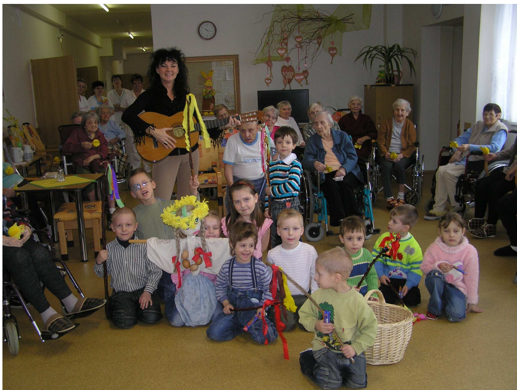
Oslavit svátky jara přišly s našimi obyvateli také děti z Mateřské školy Radost, s.r.o. Tvářičky jim zářily jako malá sluníčka a nás příjemně zahřály.