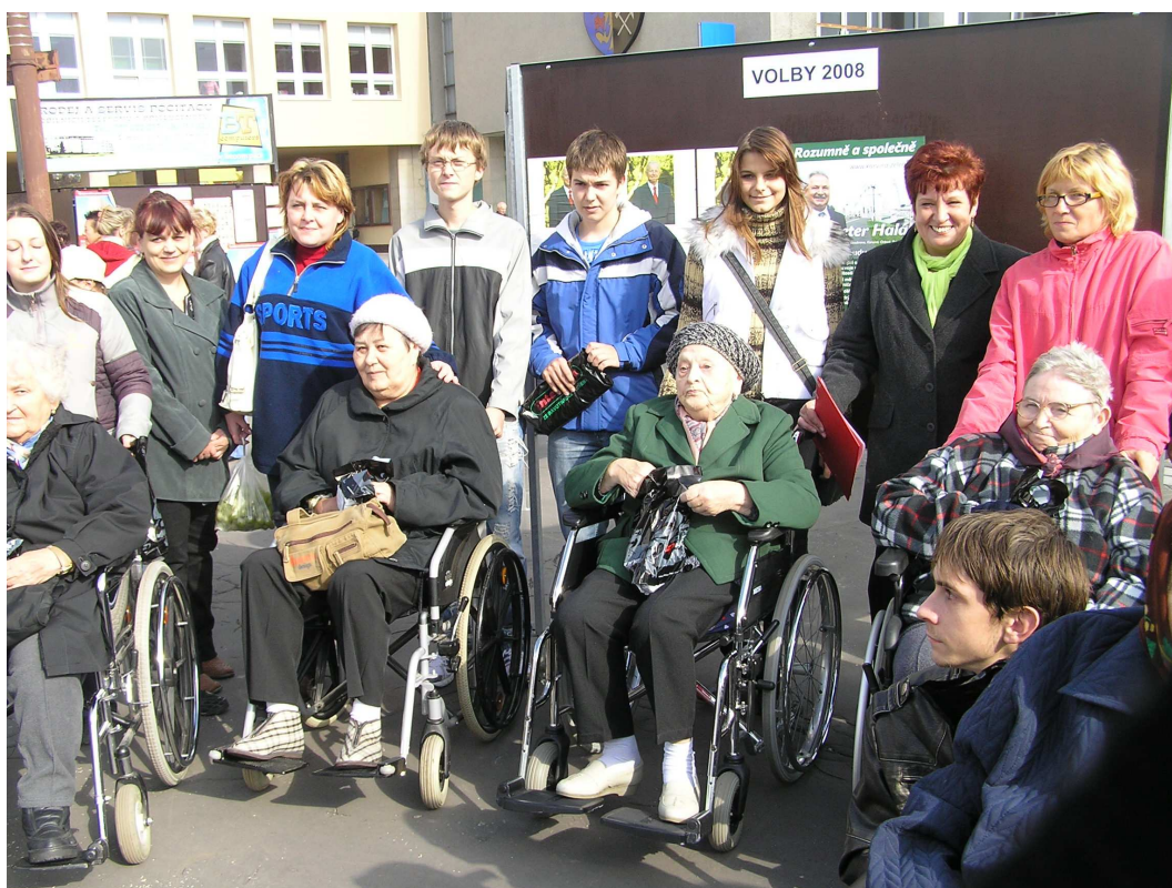
O tom, že se obyvatelé aktivně účastní života našeho Města Orlová, svědčí i účast na akci „Nesedávej panenko v koutě aneb Týden pro inkluzi.“